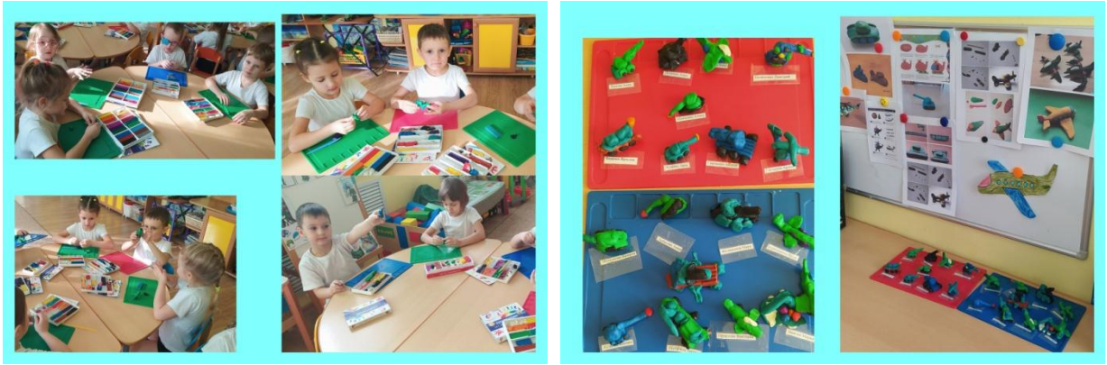
12. Рисование «Наша Армия нас бережет»