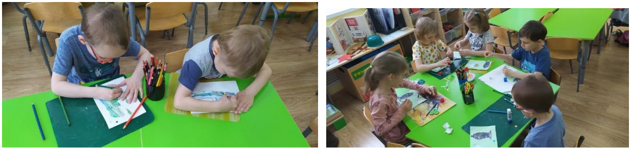
13. Выставка детских рисунков «Наша Армия нас бережет»